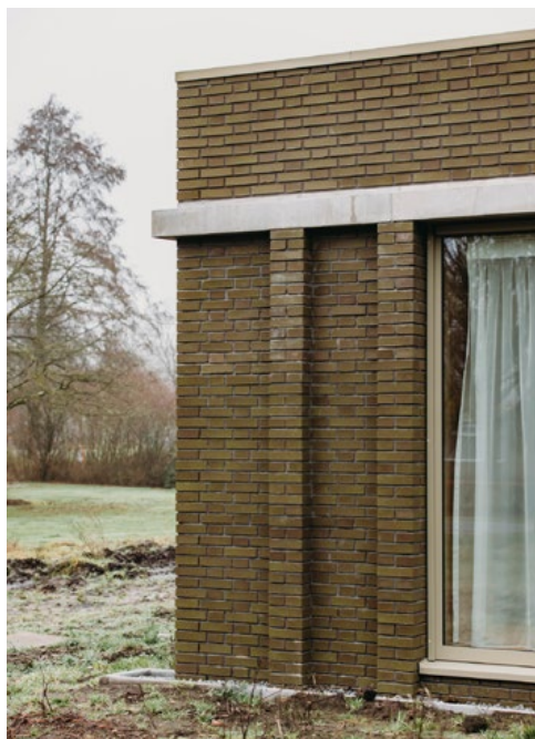
Top - Veilige en vlakke detaillering in het HIC park. Midden - Tegenover het sterke geveelrime met reliëf naar de buitenwereld toe. Boven - Aansluiting van de gevel in het landschap.