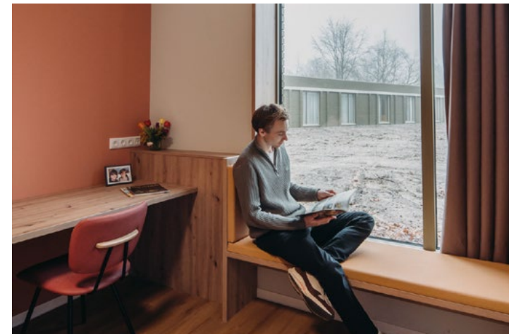
Boven - Schaalsprongen van gemeenschappelijk naar privé. Links - Plattegrond vlinder. Heldere zichtlijnen vanaf de centrale ruimtes naar de afdelingen.

“Veiligheid is essentieel in de nieuwe HIC. Hoeken en nissen worden gemeden, personeel kan vanuit het centrale punt veel overzien en alles is snel te bereiken bij een calamiteit.”