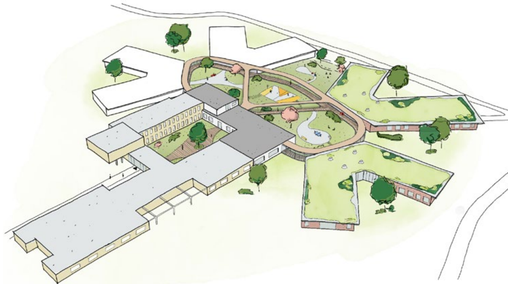
Boven - Vogelvlucht. De twee witte 'vlinders' kunnen in een later stadium worden toegevoegd. Rechts - De HIC ligt in een prachtige bosrijke locatie aan de Dennenweg in Assen.

Door slimme positionering van af te sluiten deuren kunnen de milieus ook verdeeld worden in vier of acht kamers. Elk submilieu heeft haar eigen woonkamer als veilige en beschutte verlenging van het domein van de patiënten, met uitzicht op de groene omgeving. Daklichten en ramen aan het einde van de gangen zorgen voor veel natuurlijk daglicht, ook in de inpandige ruimten.