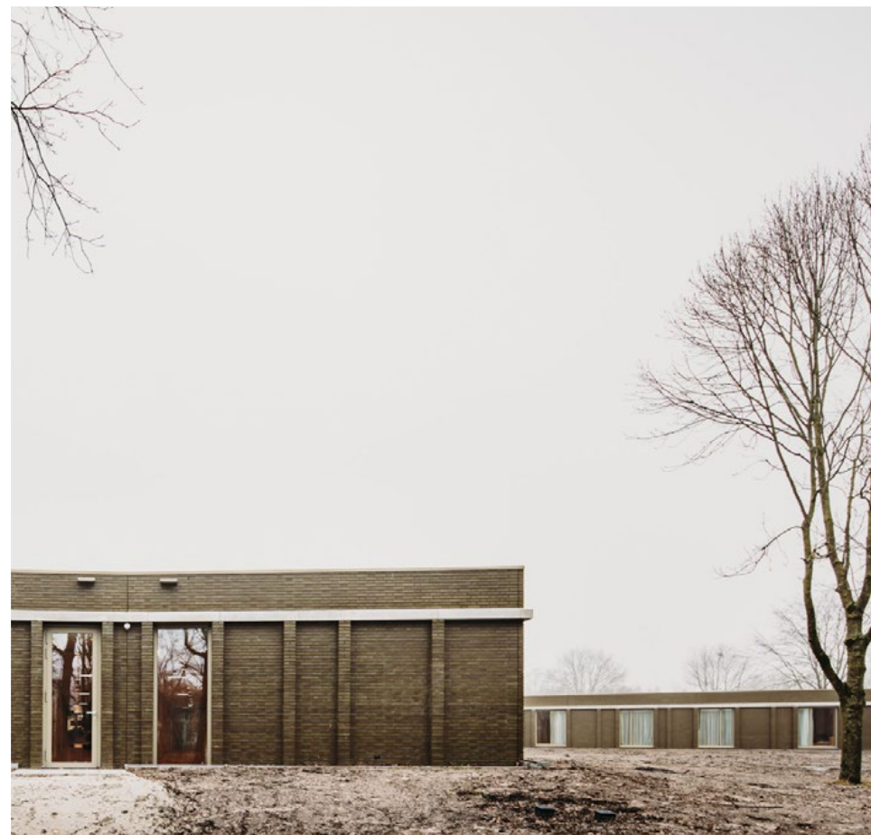
Boven - Kopgevel van de vlinder met dynamische en vriendelijke uitstraling. Onder - Doorsnede van de vleugel. Het landschap loopt op tot de ramen, daglicht reikt tot diep in het gebouw.