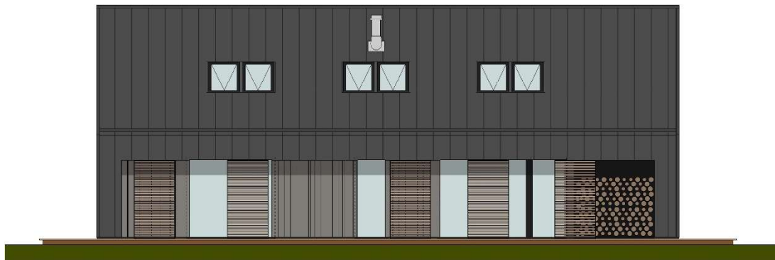
ZUIDGEVEL - NIEUW