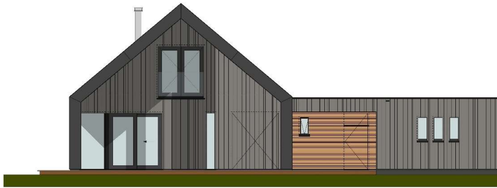
WESTGEVEL – NIEUW