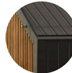
goot in dakvlak / zonder goot