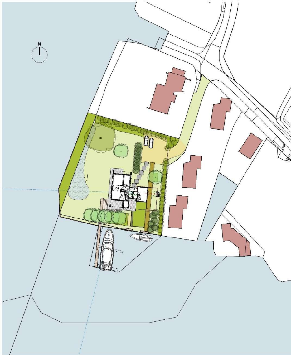
SITUATIE – NIEUW