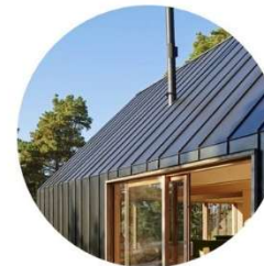
dak en gevel in fellsysteem