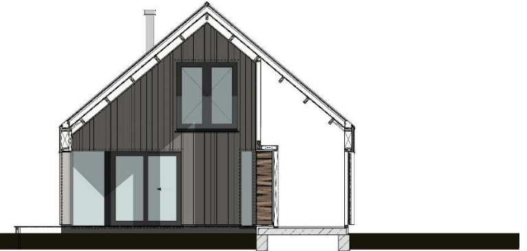
DOORSNEDE - NIEUW