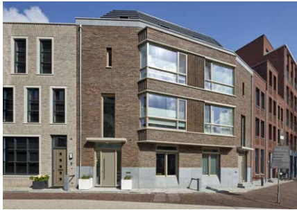
Stadskarakter 6 met erker optimaliseert het uitzicht en de bocht

betrokken architecten: Bedaux de Brouwer architecten HILBERINKBOSCH architecten HP architecten Mulleners + Mulleners architecten