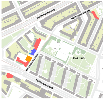
Oude situatie: 1 hoofdgebouw en 3 dependences

De Nicolaaschool heeft zowel als locatie, maar ook als sociaal hart een centrale positie in de wijk Bospolder-Tussendijken. We houden de nieuwbouw bewust op subtiel wijze iets los van het bestaande gebouw, maar in uitstraling zorgen we er echter wel voor dat de gebouwen duidelijke familie zijn van elkaar en samen één school vormen. Het volume van de nieuwbouw steekt uit ten opzichte van oudbouw en we geven het een sterk accent op de hoek, zodat een duidelijke verbinding met het Park 1943 wordt gemaakt.