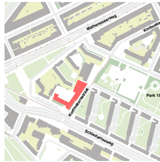
Nieuwe situatie: Nicolaaschool in één gebouw