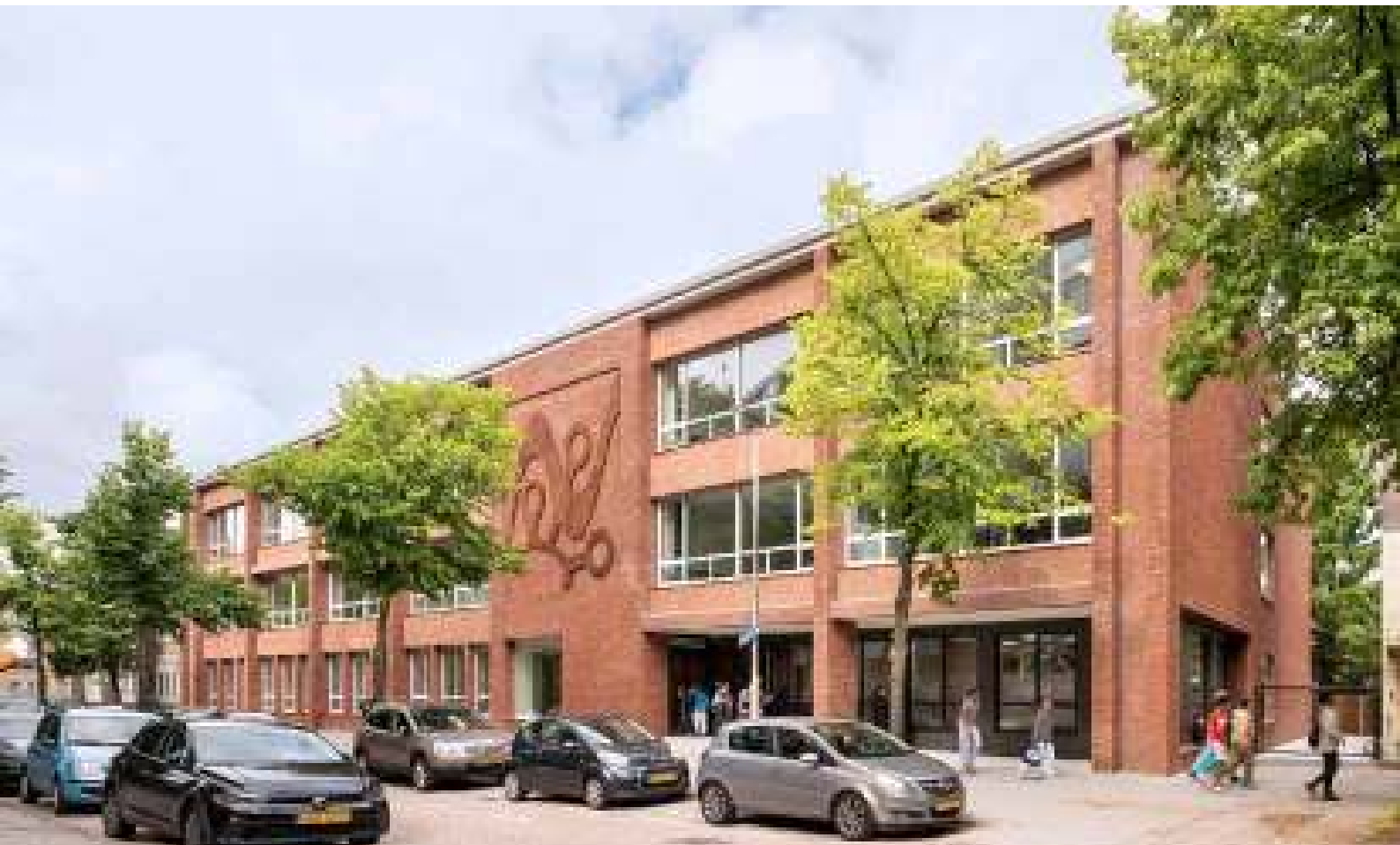
Een logische aansluiting op de omgeving aan de straatzijde. We maken een duidelijke markering richting het park. We leggen de plint hier terug en openen het gebouw naar straat en park.